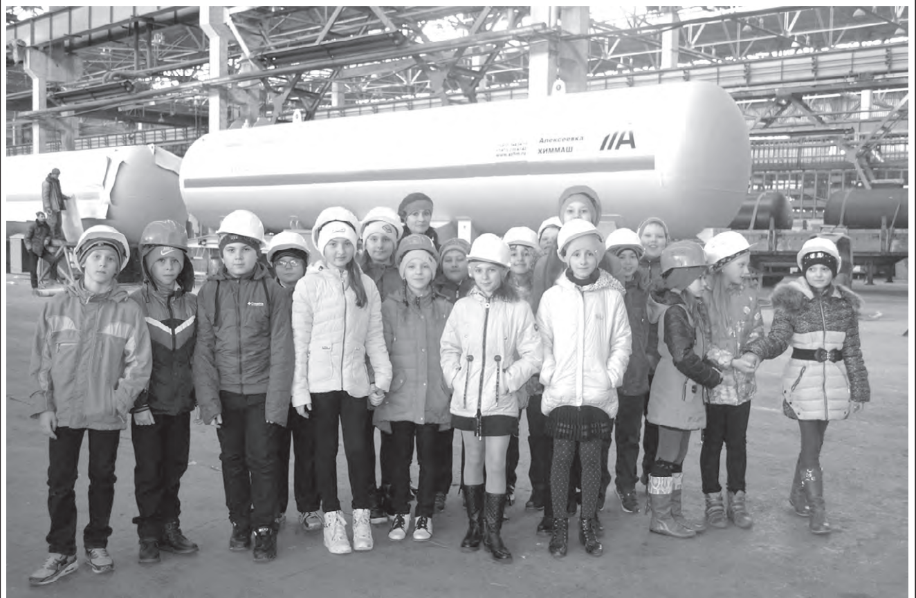
Кто-то из этих школьников наверняка захочет стать машиностроителем.

ВТОРНИК, 4 апреля: температура: днём +11°, ночью +7°; давление (мм рт. ст.) 760; ветер (м/с) 5, северо-восточный, пасмурно.