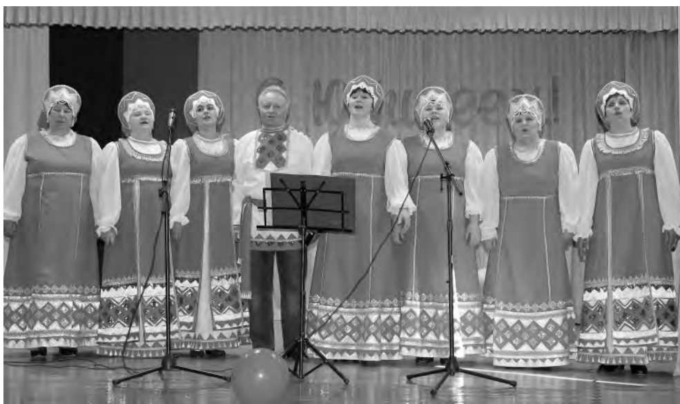
Выступает вокальный ансамбль дома культуры.

Сегодня дом культуры по-прежнему привлека-